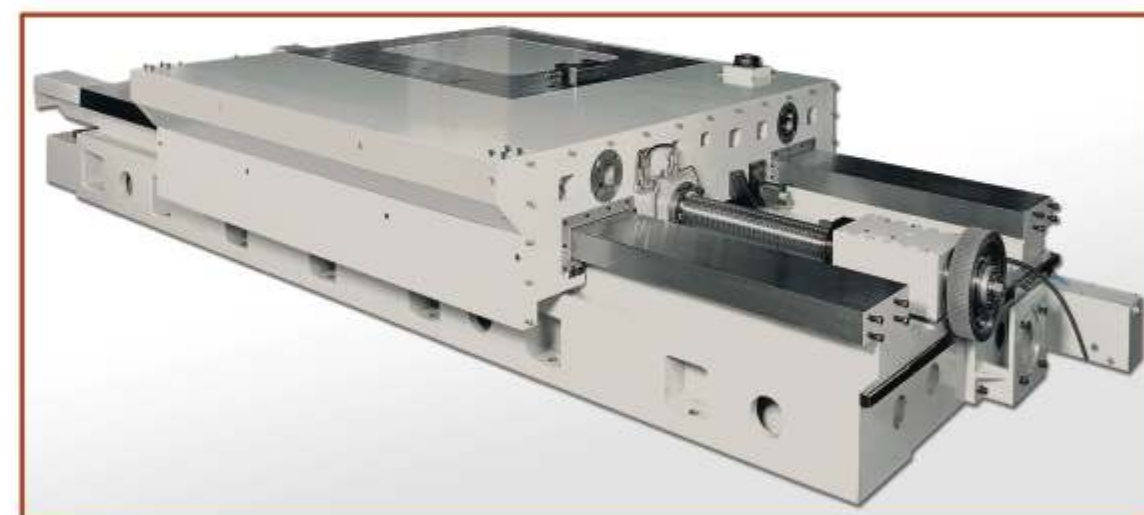
▲ PARTICOLARE ASSE V